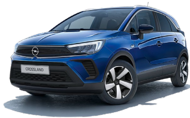
GRANATOWY NAUTIK /