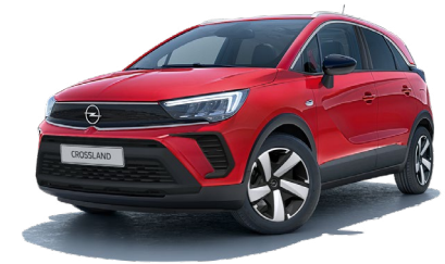
CZERWONY KARDIO /