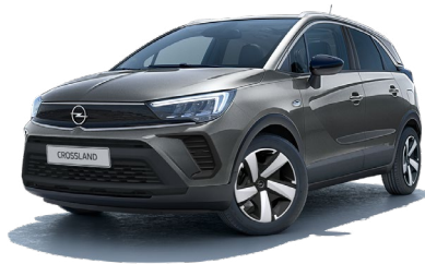
SZARY VULKAN /