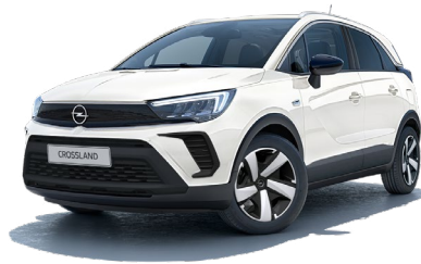
BIAŁY ARKTIS /