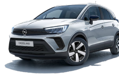
SREBRNY KRISTALL /