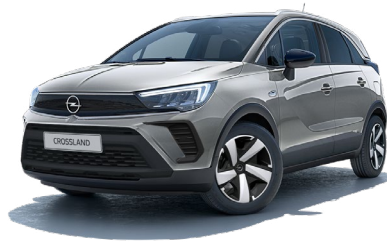
SZARY KONTRAST /