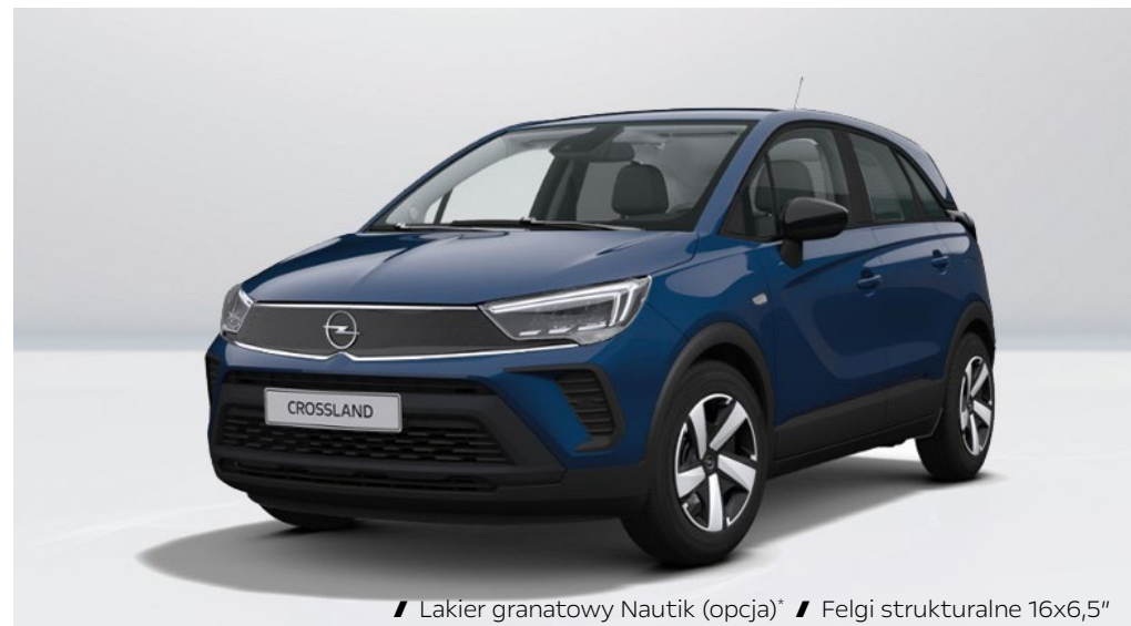
// Lakier granatowy Nautik (opcja)* // Felgi strukturalne 16x6,5"