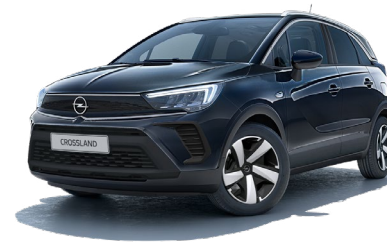
CZARNY KARBON /