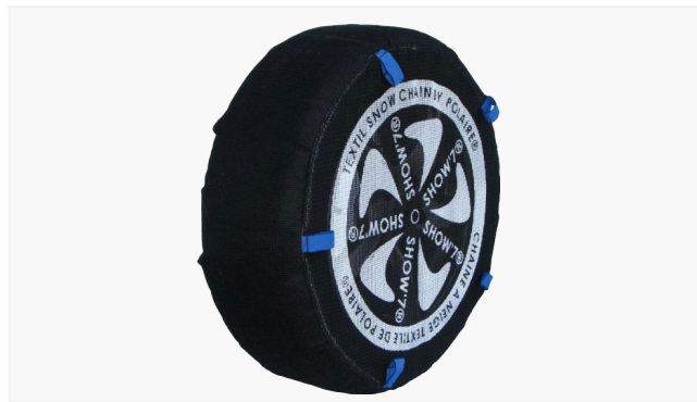
KOMPLET 2 NAKŁADEK PRZECIWPÓŚLIZGOWYCH - „SKARPETA”