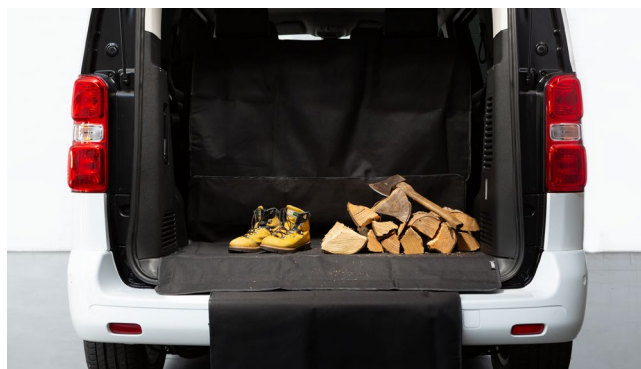
MATA PODŁOGI BAGAŻNIKA

nr części: 1 614 086 280 wersja L2 2 rzędy siedzeń