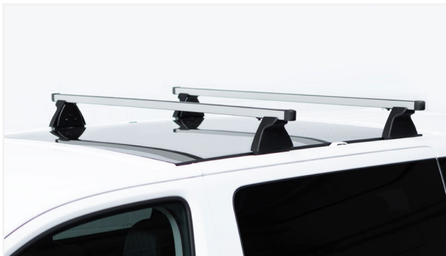
BELKI DACHOWE ALUMINIOWE