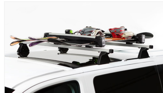
UCHWYT NA NARTY/SNOWBOARD THULE SNOW PACK 7324