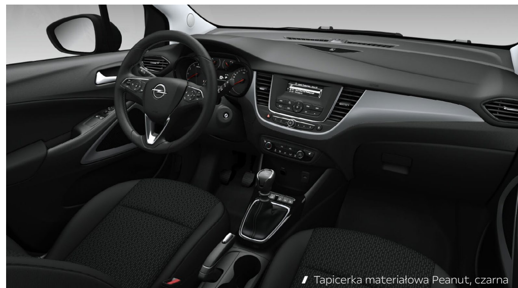
// Tapicerka materiałowa Peanut, czarna