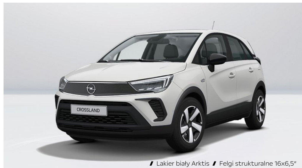
// Lakier biały Arktis // Felgi strukturalne 16x6,5"