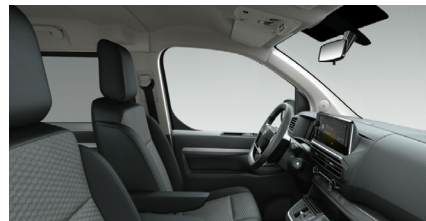
Tapicerka Rimini BRFY