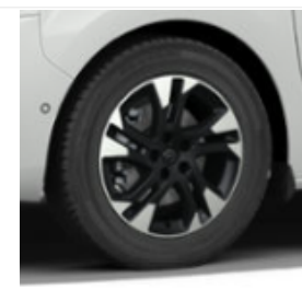
Felgi aluminiowe 17x70