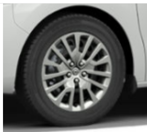
Felgi stalowe 17x70