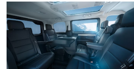
4 siedzenia ze stolikiem AN01