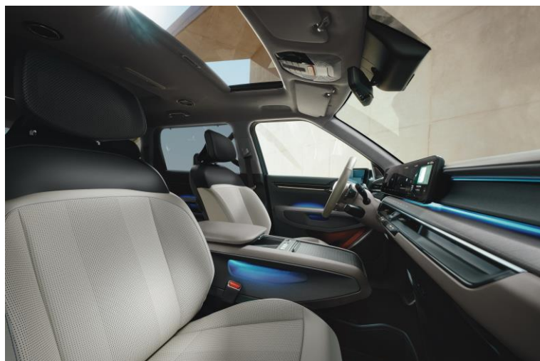
Wersja Earth wnętrze EMA