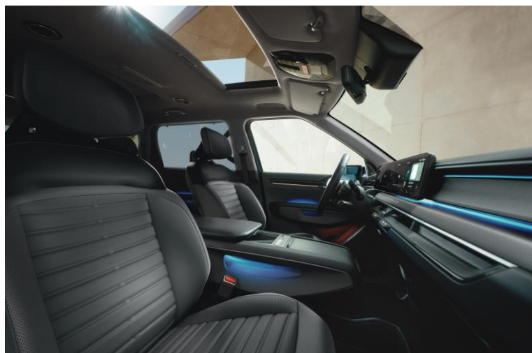
Wersja Earth wnętrze RBQ, opcja CP1