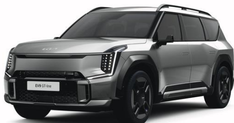
Pebble Grey (DFG) metalizowany