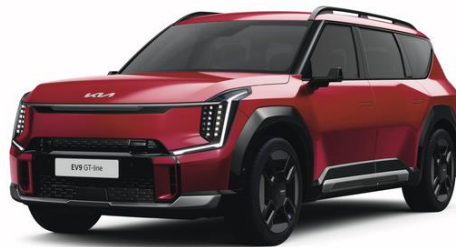
Flare Red (C7R) metalizowany, nieдоступny z tapicerką NJR, lakier bez dopłaty