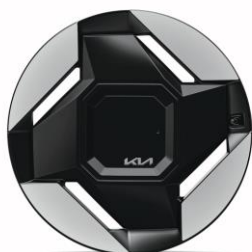
19" felgi aluminiowe (Earth)