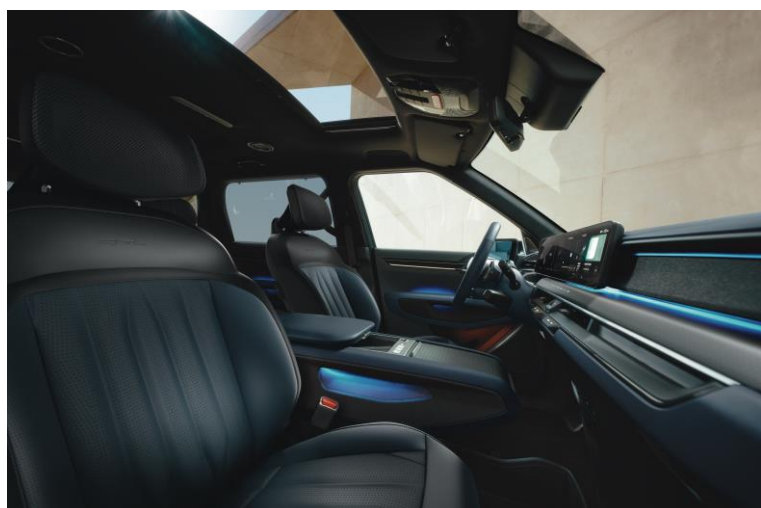
Wersja GT-Line wnętrze NJR