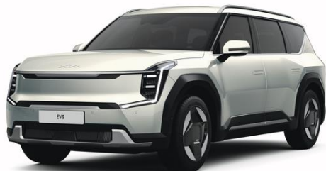
Ivory Silver (ISG) metalizowany, nieдоступny dla GT-Line