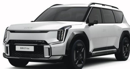
Snow White (SWP) metalizowany