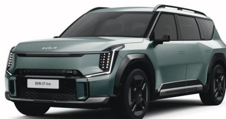
Iceberg Green (IEG) metalizowany