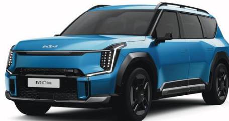
Ocean Blue (OBG) metalizowany, nieдоступny dla Earth