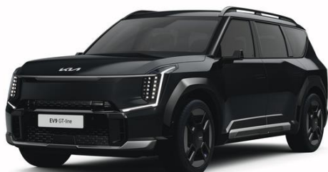
Aurora Black (ABP) metalizowany