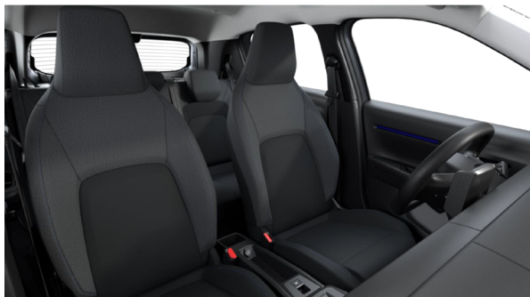
Tapicerka materiałowa: czarno-szara Tissu Noir / Tissu Gris Chiné (NAFX)