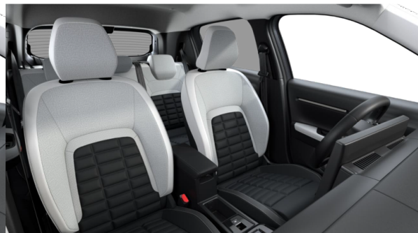
Tapicerka materiałowa: Metropolitan Grey (NHFX)