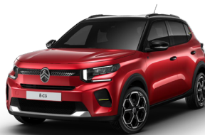
PERLA NERA BLACK z lakierem ELIXIR RED