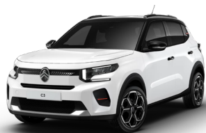
PERLA NERA BLACK z lakierem POLAR WHITE