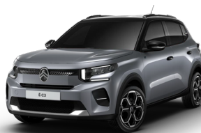
PERLA NERA BLACK z lakierem MERCURY GREY