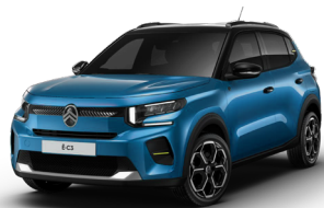
PERLA NERA BLACK z lakierem BRIGHT BLUE *