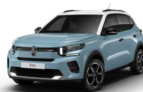
OPAL WHITE z lakierem BLEU MONTE CARLO