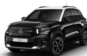
OPAL WHITE z lakierem PERLA NERA BLACK