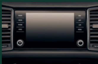
System nawigacji Amundsen 8" z mapą Europy