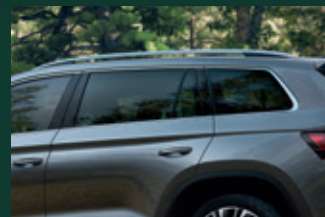
SunSet tylne szyby boczne i szyba pokrywy bagażnika o wyższym stopniu przyciemnienia