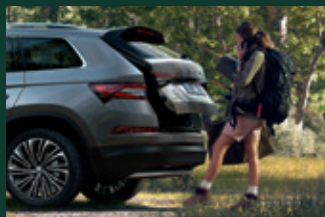
Elektrycznie sterowana pokrywa bagażnika z bezdotykową obsługą