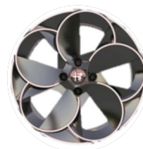
18" Felgi aluminiowe Diamond Cut Kod opcji 1M5