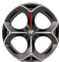
20" Felgi aluminiowe Perfo Kod opcji 5RK