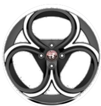
18" Felgi aluminiowe Progressive Kod opcji WP8