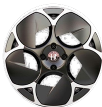
18" Felgi aluminiowe Aero Kod opcji 2VX