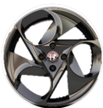
17" Felgi aluminiowe Diamond Cut Kod opcji 1M3